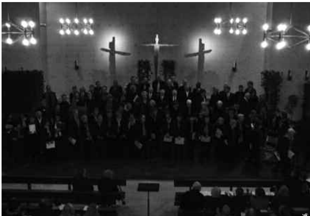
Alle vier Chöre gemeinsam.