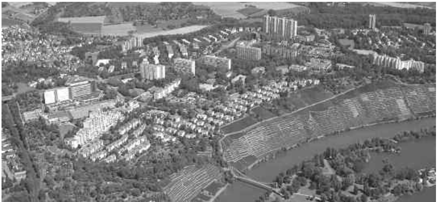
Die Hochhäuser beherrschen das Bild der beiden Stadtteile Freiberg und Mönchfeld.