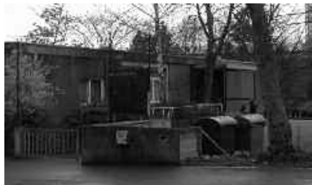
Das alte Jugendhaus „Jugi“ 1972.