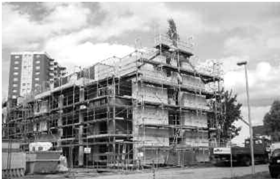
Der Neubau der BG Neues Heim an der Hechtstraße/Ecke Flundernweg beim Richtfest am 16.09.2010