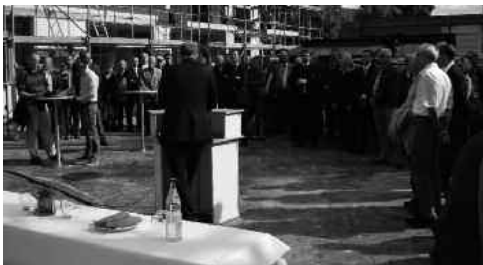
Zahlreiche Gäste sind der Einladung zum Richtfest gefolgt.