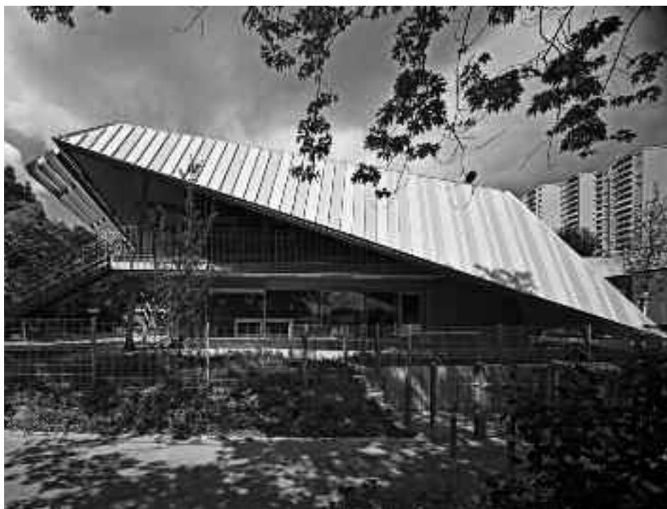
Unter dem bunt gestreiften Dach des Emma-Schwab-Hauses sollen sich die Kinder beschützt fühlen.

Die vorher auf diesem Grundstück stehende Tageseinrichtung für Kinder Wallensteinstraße 13, Emma-Schwab-Haus, war mit sieben Betreuungsgruppen in zwei aus den Jahren 1968 und 1973 stammenden Gebäuden untergebracht. Beide Gebäude konnten nicht mehr wirtschaftlich sinnvoll saniert werden und mussten deswegen abgebrochen werden. Im Auftrag des Amtes für Lie-