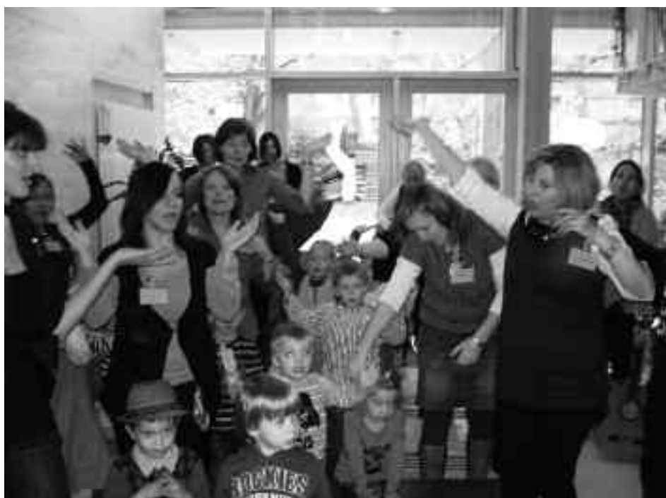
Die Kinder freuen sich mit den Erzieherinnen über die neue Kita.