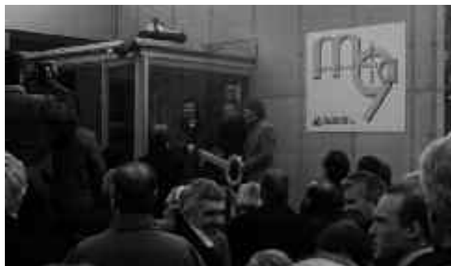
Eröffnung des neuen Kinder- und Jugendhauses M9 2002.

Kontakt: Kinder- und Jugendhaus M9, Makrelenweg 9a, 70378 Stuttgart Tel: 0711/843946 E-Mail: freiberg@jugendhaus.net